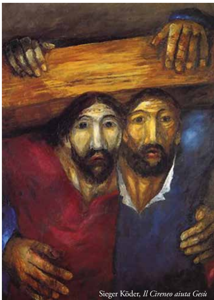
Sieger Köder, Il Cireneo aiuta Gesù

Niente e nessuno potrà mai più separarci da Lui, il Crocifisso Risorto, se non scegliamo noi di abbandonarlo, perché ci ha inseguiti fin nella morte e non smette di incontrarci e sostenerci su ogni via di dolore che sale ogni Golgota, di accompagnarci e illuminarci su ogni strada di disperazione che scende verso Emmaus, di mostrarci i segni indelebili dell'amore dentro ogni stanza sbarrata dalla paura.